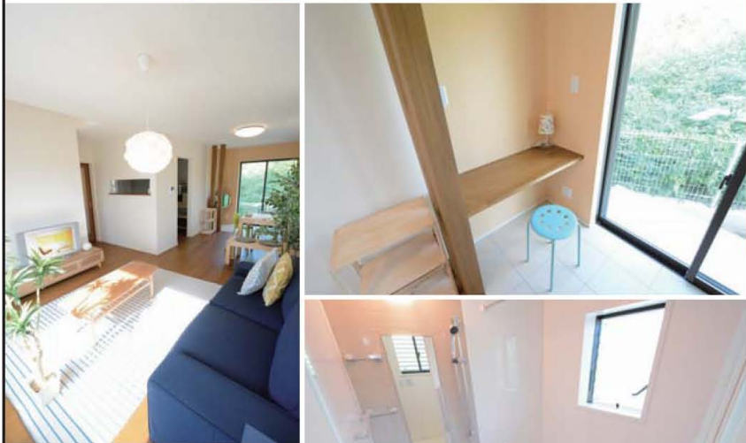
■14号地外観写真 (平成28年10月撮影)

自然豊かな環境と利便性を兼ね備えた希少の地「荒牧」 ○フリープランの自由設計可能区画有り(モデルハウス以外)