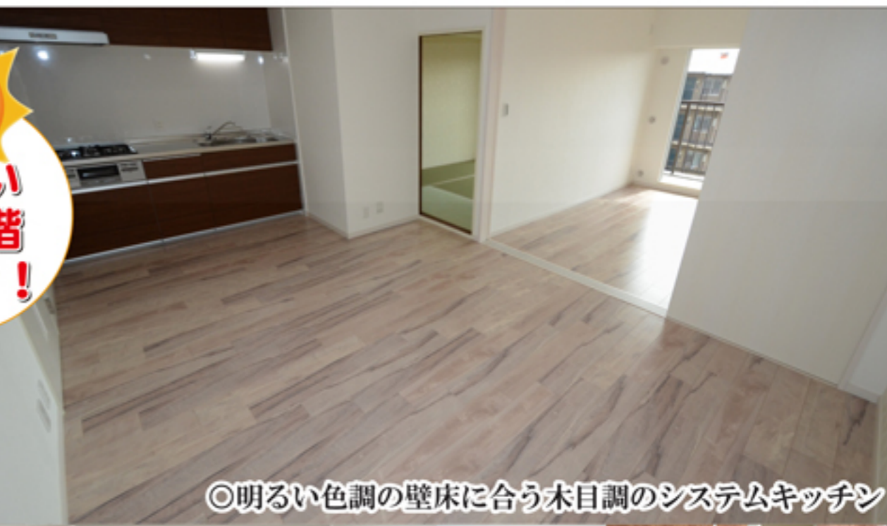
◎明るい色調の壁床に合う木目調のシステムキッチン