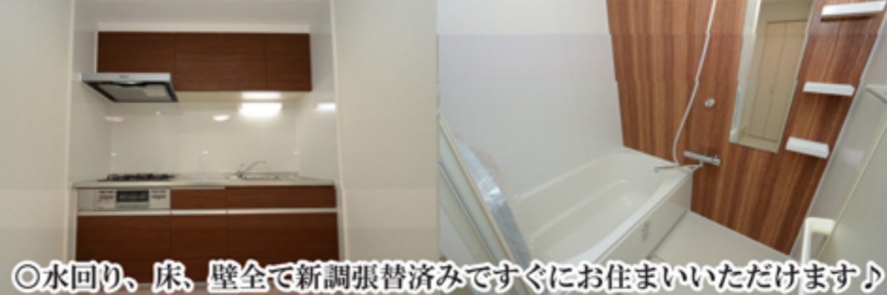
◎水回り、床、壁全て新調張替済みですぐにお住まいいただけます♪