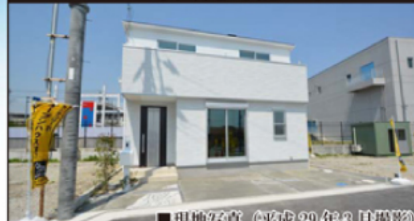
■現地写真(平成29年3月撮影)