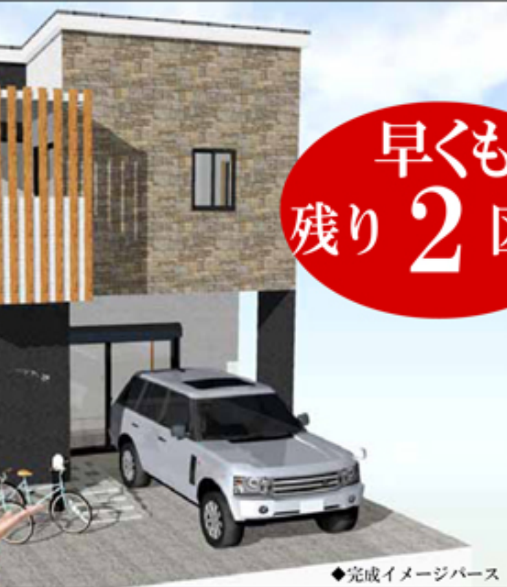
◆完成イメージパース