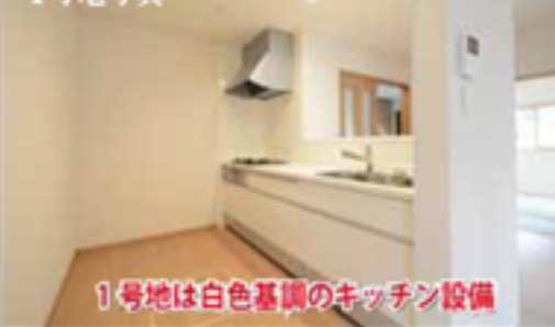
1号地は白色基調のキッチン設備