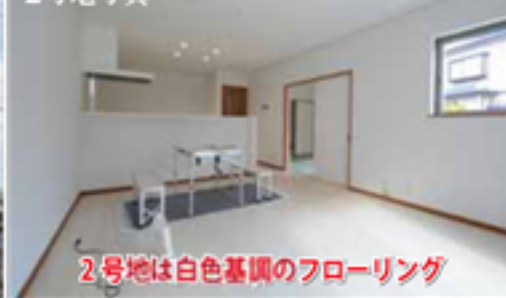
2号地は白色基調のフローリング