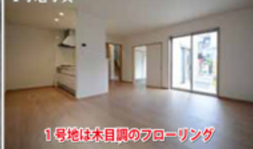
1号地は木目調のフローリング