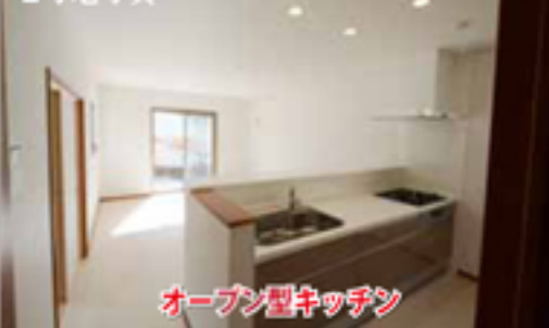
オープン型キッチン