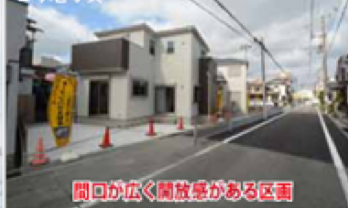
間口が広く開放感がある区画