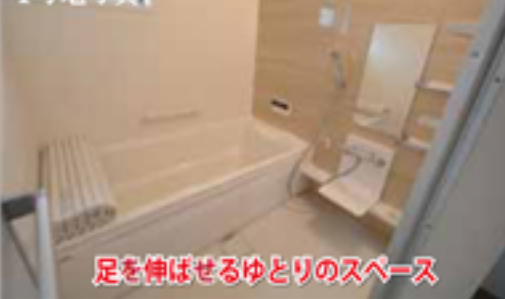
足を伸ばせるゆとりのスペース