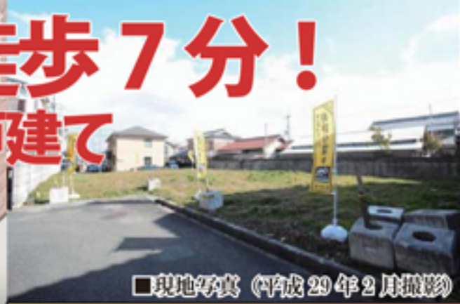
■現地写真 (平成29年2月撮影)

■所在地/尼崎市南清水24-8付近 ■交通/JR福知山「猪名寺」駅 徒歩7分 ■分譲価格/2,980万円～3,080万円 (税込) ■土地面積/100.00～101.9㎡ ■建物面積/90.18～91.80㎡ ■建ぺい率60% ■容積率/200% ■用途地域/第1種住居地域 ■東側私道幅員約4.4m接道 (C号地) ■設備/都市ガス・関西電力・公共上下水 ■建築確認番号/H28確認建築CLASO1902号他 ■総戸数/3戸 ■販売戸数/3戸 ■学区/園田小学校・園田北中学校 ■完成年月/平成29年5月完成予定 ■引渡時期/相談 ■取引形態/仲介 ■広告有効期限/平成29年5月末日 ※掲載写真は同社施工例写真を使用しております。