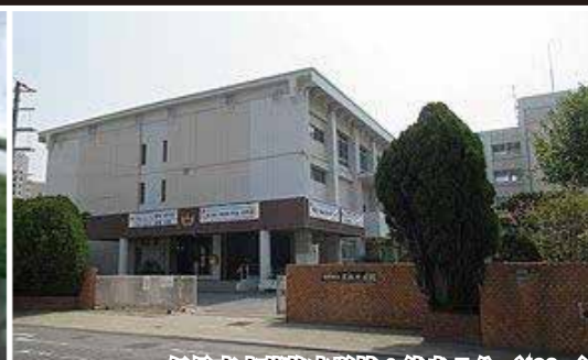
伊丹市立荒牧中学校：徒歩7分 (493m)