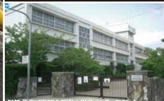
伊丹市立天神川小学校：徒歩10分 (747m)