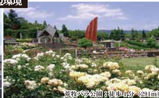
荒牧バラ公園：徒歩4分 (291m)