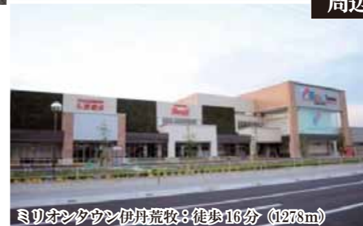
ミリオンタウン伊丹荒牧：徒歩16分 (1278m)