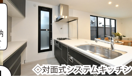
◇対面式システムキッチン