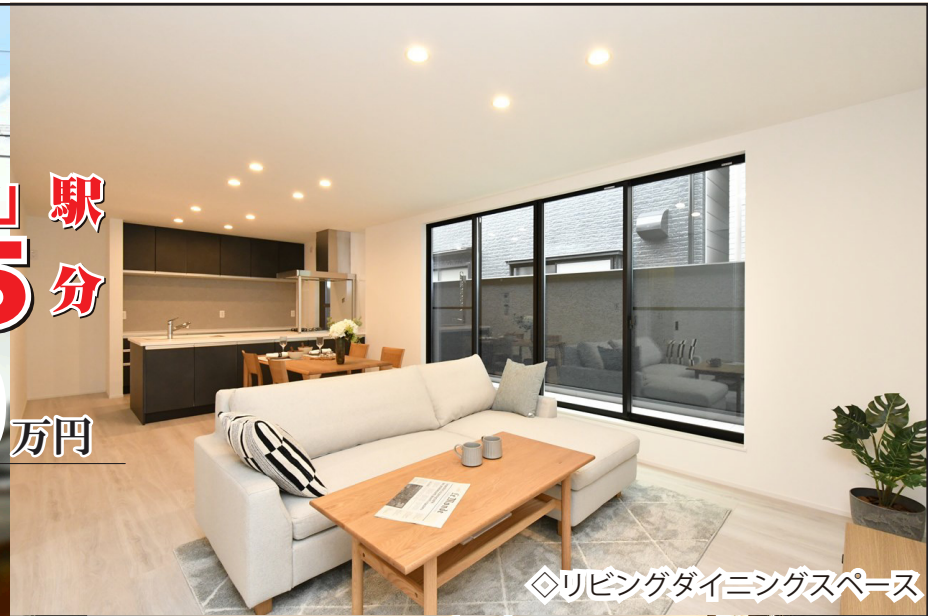
◇リビングダイニングスペース