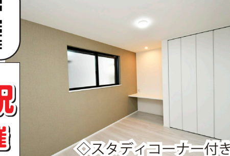
◇スタディコーナー付き