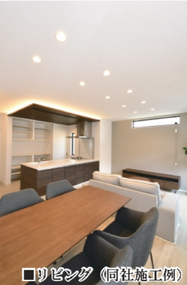
■リビング (同社施工例)