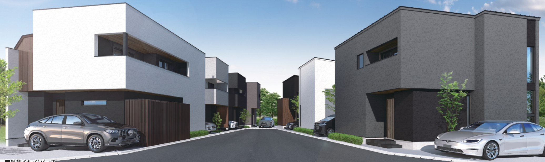
■外観イメージパース

モレスでは、住環境や利便性など優れたロケーションの住宅地を選び、土地形状も住宅設計がしやすい土地からデザインされた住まいをお届けします。