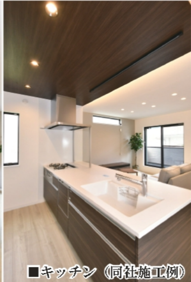
■キッチン (同社施工例)