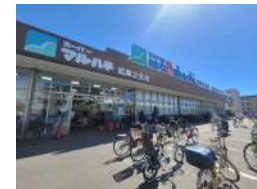
日々の買い物には スーパーマルハチが便利