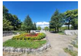
西武庫公園 休日のお出かけスポットに お勧めの大型公園