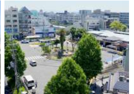
阪急武庫之荘駅 徒歩19分