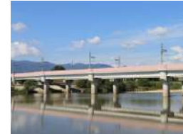
阪急武庫川新駅 (仮称) 徒歩5分